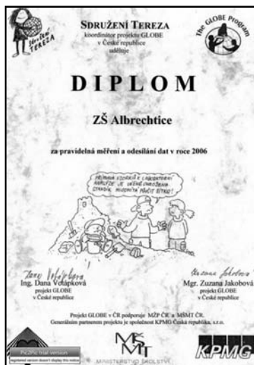
▲ Diplom o pravidelném měření v projektu GLOBE.

Od října 2006 pokračujeme v projektu GLOBE, který spolupracuje s NASA v USA. Naše pravidelné ekologické pozorování stavu řeky Stonávky jsme rozšířili o meteorologická měření (teplota a vlhkost vzduchu, typ oblačnosti) v meteorologické budce umístěné na nádvoří naší školy. Všechny výsledky zasíláme do USA pomocí internetu. Za loňská měření jsme obdrželi diplom.