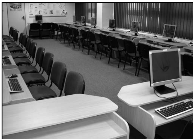
▲ PC učebna

V současné době tedy máme dvě výborně vybavené učebny PC. V první se nachází 13 žákovských pracovišť, učebna je vybavena velkou interaktivní tabulí, dataprojektorem a ozvučením systémem 5+1. V druhé – nové učebně je 15 žákovských pracovišť, vybavených moderními, kvalitními a rychlými počítači se 17 palcovými LCD monitory. Taký tato učebna je doplněna dataprojektorem. Správcem učebny je Mgr. Irena Ruhswurmová – aprobovaný vyučující informatiky.