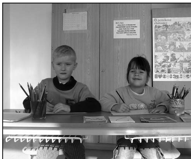
▲ Zápis do 1. třídy.