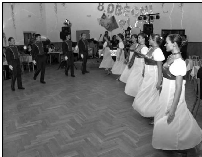
▲ Taneční program souboru „Suszanie“.