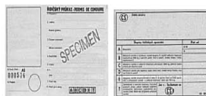
ŘP vydány v období: 1992-1993