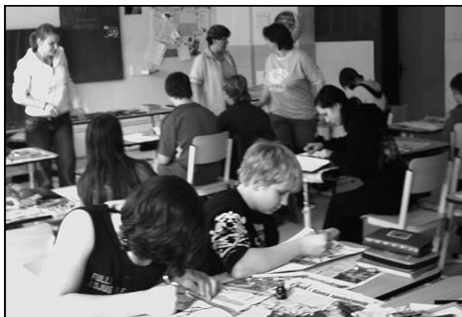
▲ Žáci při skupinové práci

Ve všech vyučovacích předmětech byla výuka zaměřena na učivo, které se nějakým způsobem dotýká tématu Evropa. V českém jazyce žáci zkoumali odlišnosti i shody českého a slovenského jazyka a sami zkusili, jak jsou schopni tomuto jazyku porozumět a také ho používat. V matematice se naučili tvořit různé druhy grafů a zpracovávat data prostřednictvím údajů o různých geografických a ekonomických ukazatelích, jako je například počet obyvatel a rozloha evropských států. V zeměpise se podrobněji seznámili s některými evropskými národy – s Laponci, Italy, Romy. Také výtvarná výchova vedla žáky k uvědomění si rozdílů mezi evropskými kulturami a národy a zároveň si žáci mohli vyzkoušet různé výtvarné techniky. Přírodopis je zase seznámil s národními parky,