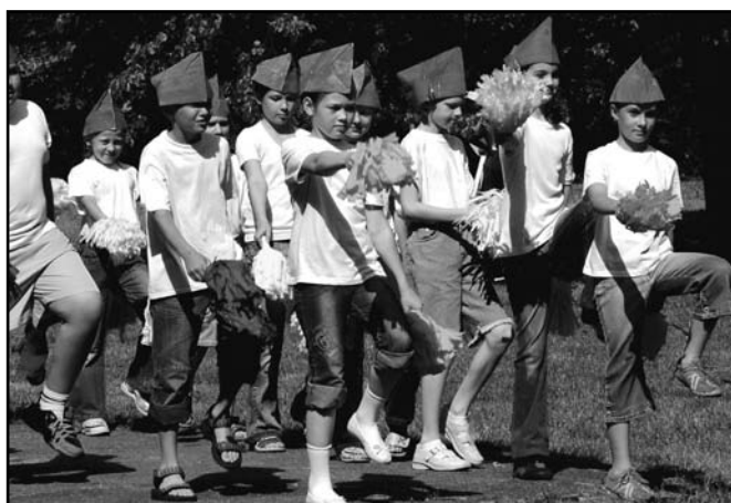
▲ Vystoupení žáků 3. a 4. tříd