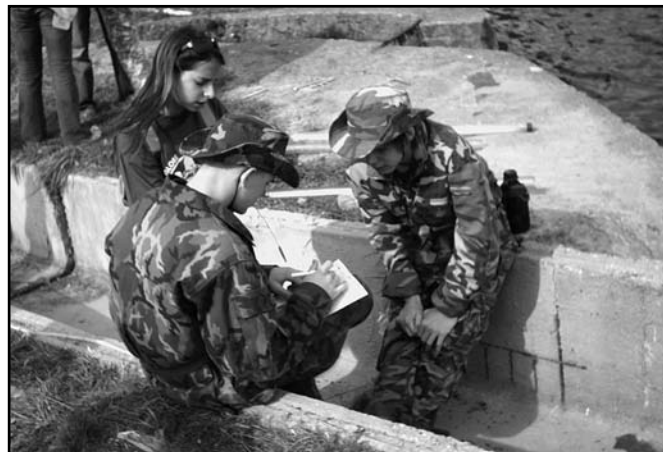
▲ Měření přítoku do místního rybníku