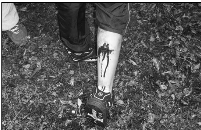
▲ Takto vypadala zranění