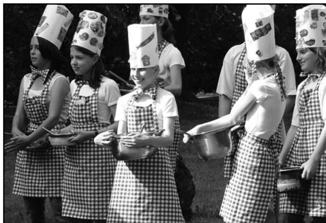
▲ Vystoupení žáků 5. tříd