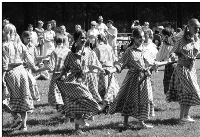
▲ Taneční vystoupení žákyň 2. stupně