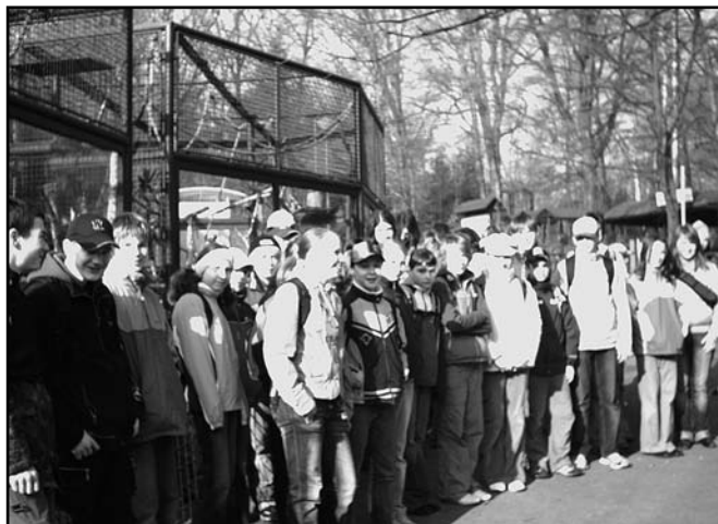
▲ Naši soutěžící