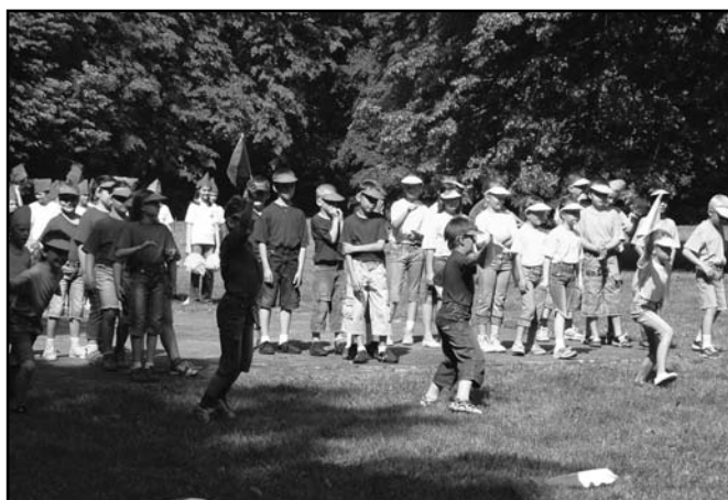
▲ Vystoupení žáků 2. třídy