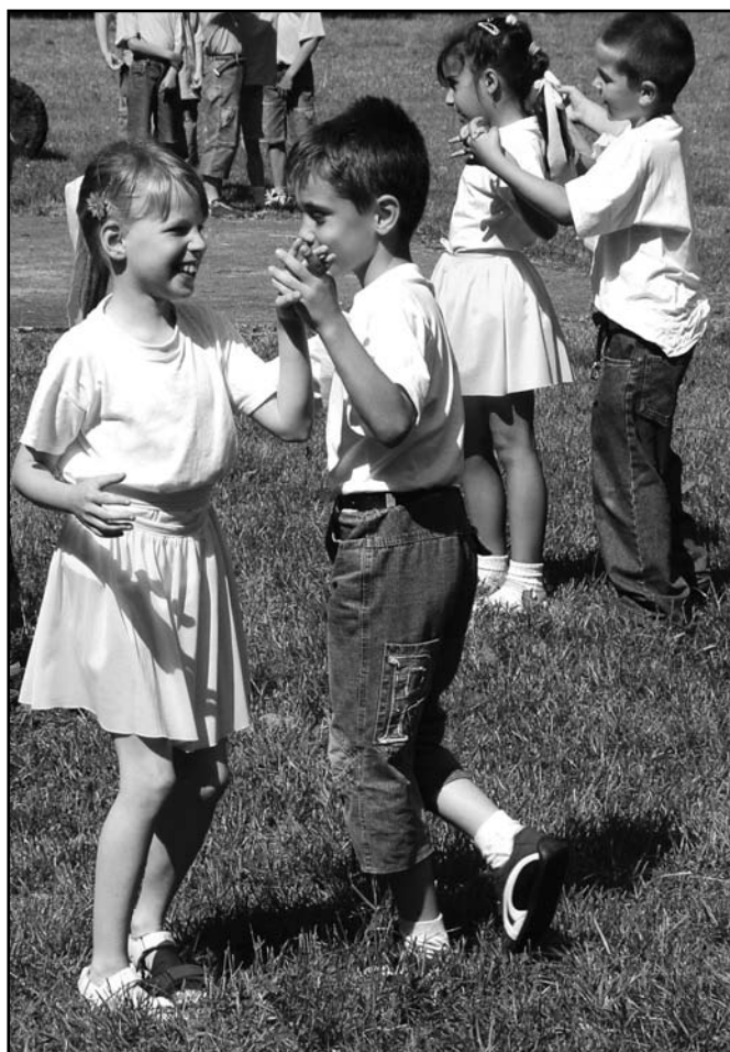
▲ Vystoupení řáků 1. tříd