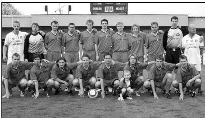
▲ FK Baník Albrechtice - muži