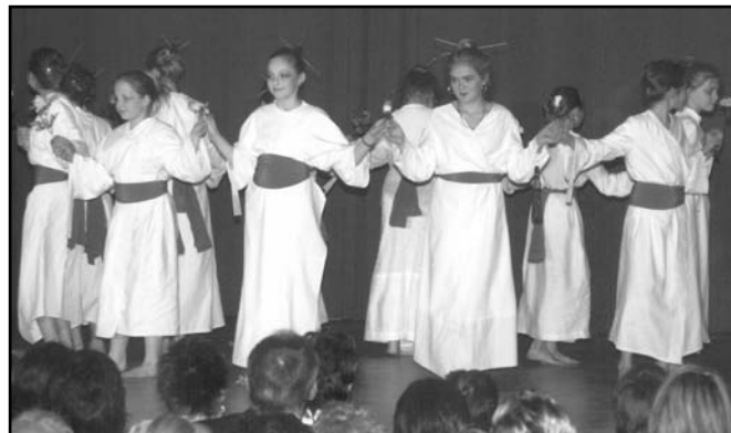
▲ Vystoupení žáků 5.B třídy.