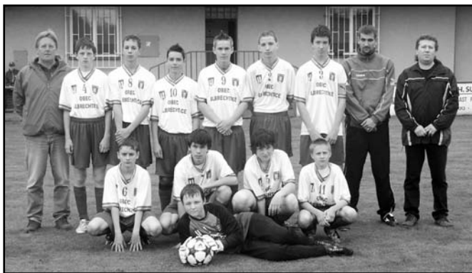
▲ FK Baník Albrechtice - starší žáci