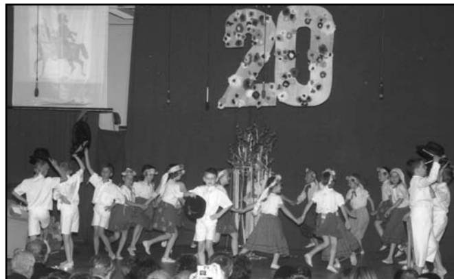
▲ Vystoupení žáků 2.A třídy.