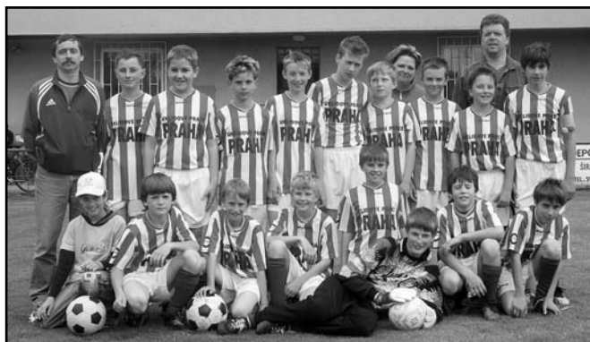
▲ FK Baník Albrechtice - mladší žáci