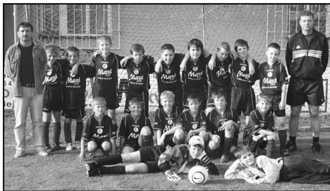
▲ FK Baník Albrechtice - minifotbal