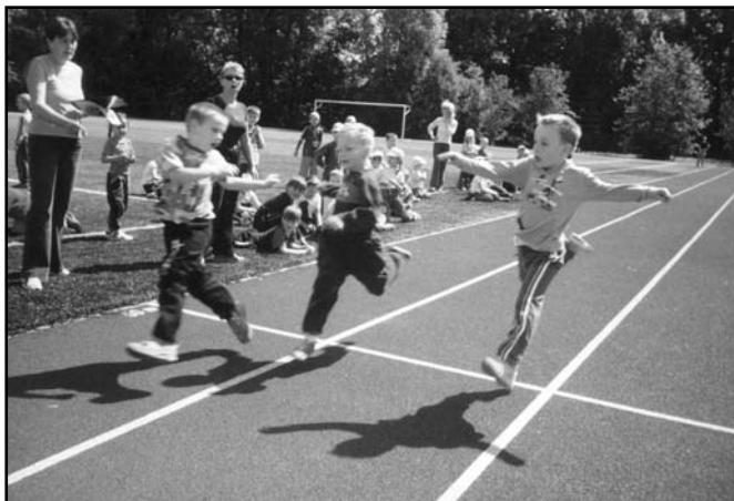
▲ Budoucí sportovní naděje.

Největší událostí v červnu je ale „Rozloučení s předškoláky a symbolické předávání p. učitelkám ze ZŠ“. Mohu říci, že je to událost na obecní úrovni. Přijdou nejen rodiče a ostatní příbuzní dětí, ale také zástupci obecní rady s panem starostou,