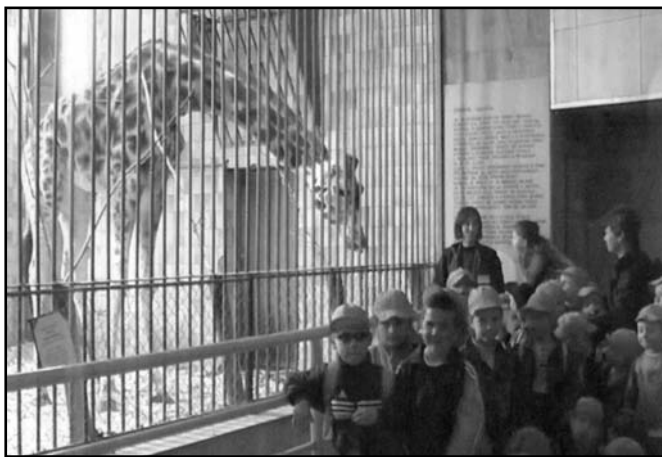
▲ Děti s „naší žirafkou“.

K tomu nám pomáhají i sběrové akce ve školce, které se již stávají tradicí a všechny mají dobrý vliv na děti. Začínáme podzimní „Celoškolní soutěž ve sběru kaštanů a žaludů“ - pro zvířátka na zimu. Nejlepší sběrači bývají oceněni u vánočního stromčeka, kde se sejde celá školka a zveme i naše důchodkyně. Dále zimní „Celoškolní soutěž ve sběru pomerančové a citrónové kůry“, jejíž výtěžek věnujeme žirafce do ZOO v Ostravě. Toto provádíme již druhým rokem a v květnu jsme měli pěkný, slunečný půldenní výlet do ZOO. Děti tam samy předaly tyto peníze, celkem 2000,- Kč ošetřovatelce „naší žirafky Jadranky“, která velmi ocenila jakým způsobem byly peníze získány. Za odměnu jim ošetřovatelka vyprávěla zajímavosti o životě žiraf v ZOO i v normální přírodě. Ve zbývajícím čase jsme si prošli a prohlédli další zvířecí obyvatele ZOO. Než jsme opustili zoologickou zahradu, našli jsme na sponzorské tabuli u vchodu i napsanou naši školku, ještě z minulého roku. S kolegyněmi jsme se rozhodly i tuto školní