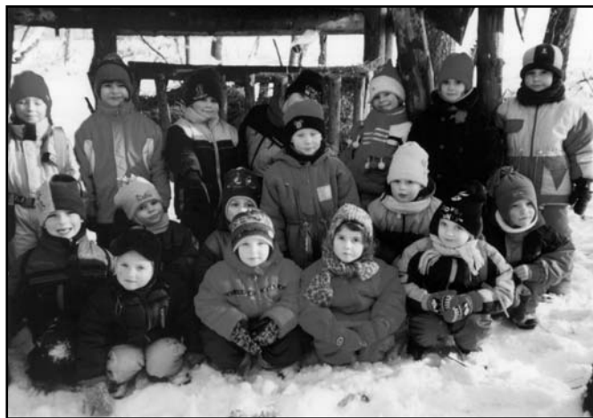
▲ Děti u krmelce.

Pro kolektiv naší školky není výše uvedený cíl předškolní výchovy celkem nic nového, ale jsme rádi, že mateřská škola jako instituce, se změnila ve školském zákoně z původního školského zařízení na nedílnou součást všech stupňů škol. Vždy bylo a také bude účelem naší pedagogické práce předávat dětem nové poznatky, učit je dívat se kolem sebe, poznávat a rozlišovat dobré i zlé, rozvíjet kvalitní hodnoty jejich osobnosti.