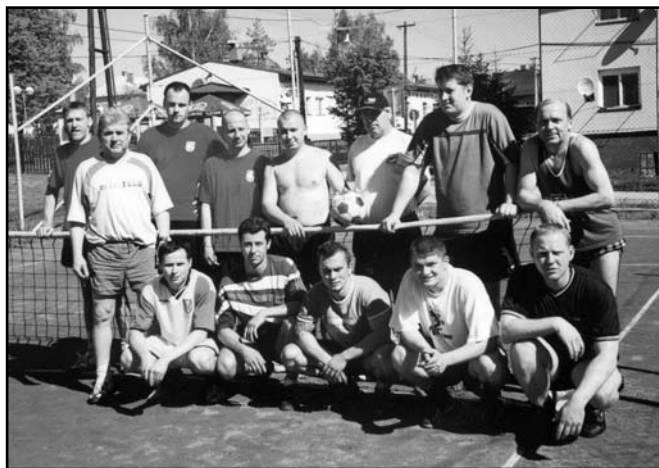
▲ Nohejbalový turnaj - květen 2005.