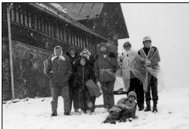
▲ Javorový - květen 2005.