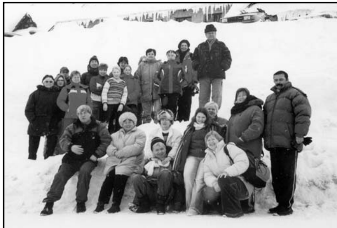
▲ Praděd - únor 2005.

Ve školním roce 2004-2005 začal pod vedením p. Krále a p. Klívara fungovat oddíl volejbalu mládeže, do kterého se mohou hlásit všechny holky a kluci od 6. třídy. Tréninky jsou každé pondělí a středu od 15.15 hodin v tělocvičně ZŠ Albrechtice.