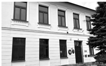
Firma JTJ EUROSERVIS s.r.o. zrealizovala hliníkové opláštění oken vstupní strany bývalé školy v Kadově.

3) Od dubna je vývoz popelnic v naší obci prováděn jedenkrát za 14 dnů, a to každé liché pondělí .