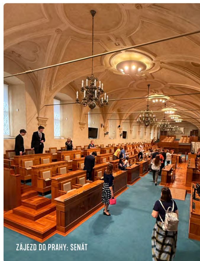
ZÁJEZD DO PRAHY: SENÁT