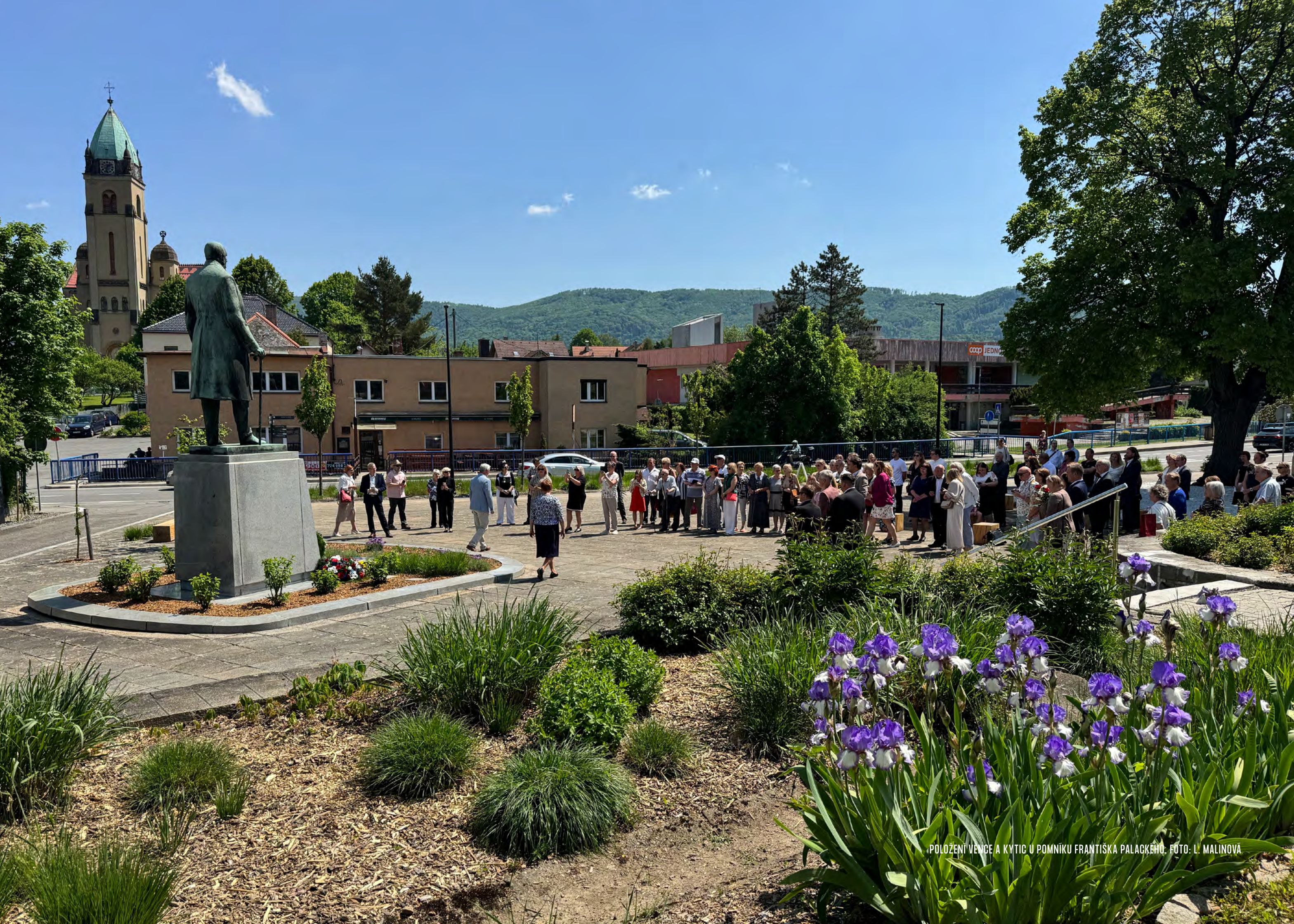
POLOŽENÍ VENCE A KYTIC U POMNÍKU FRANTIŠKA PALACKÉHO.