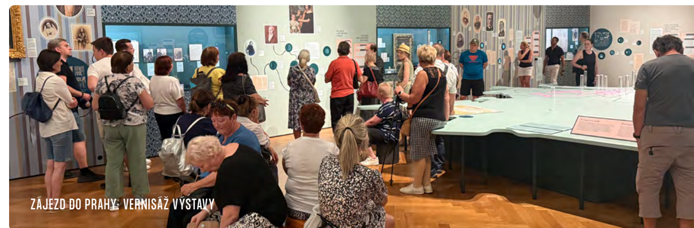
ZÁJEZD DO PRAHY: VERNISÁŽ VÝSTAVY