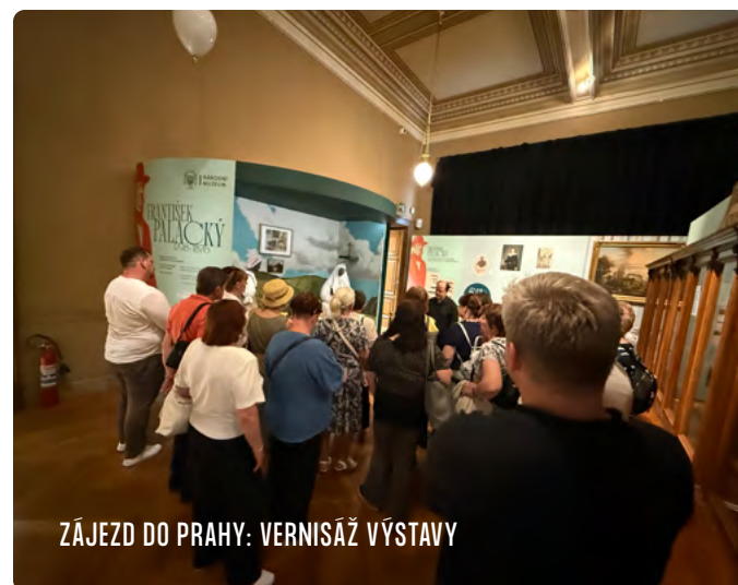
ZÁJEZD DO PRAHY: VERNISÁŽ VÝSTAVY

Vážení spoluobčané, v rámci naší účasti na soutěži Vesnice roku vznikla ve Fojtově stodole prezentace spolků, školství a obce. Tímto Vás srdečně zveme v rámci akce „Den obce a pouť“ na prohlídku do stodoly, kde zůstane tato prezentace po tento víkend zachována a stodola bude otevřená. Těšíme se, že i Vy si rádi připomenete „život“ v Hodslavicích.