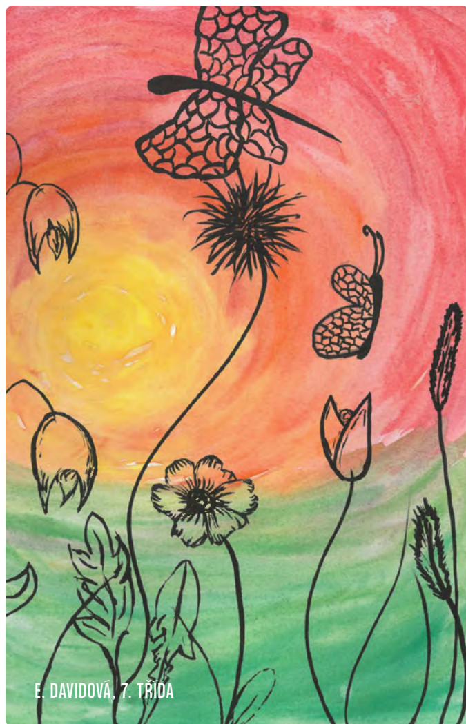
E. DAVIDOVÁ, 7. TŘÍDA

Hodslavský zpravodaj – informační měsíčník pro občany Hodslavic. Roznos (11x ročně). Náklad 550 výtisků. Adresa redakce: Obecní úřad Hodslavice, č. p. 211, IČO 00297917, zpravodaj@hodslavice.cz, 556 750 010. Příspěvky neprocházejí jazykovou úpravou. Ev. č. MK ČR E 11145. Hodslavice, č. 7/26, vydáno 7. 7. Grafická úprava: Panfolk