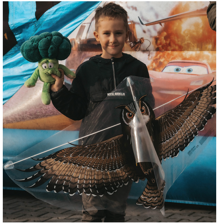
Tenhle drak vyletěl nejvýš...