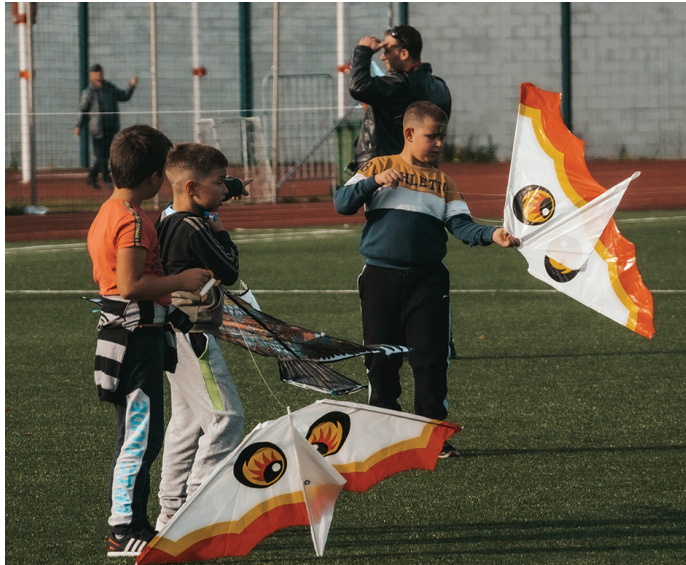
Připravení k letu.